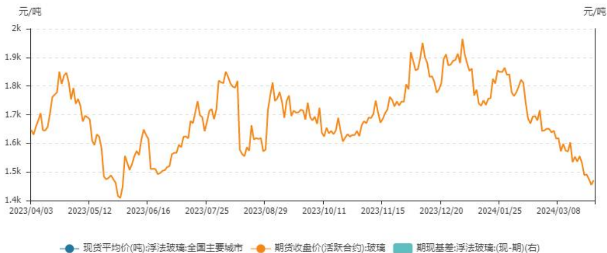
玻璃基差(连续合约)